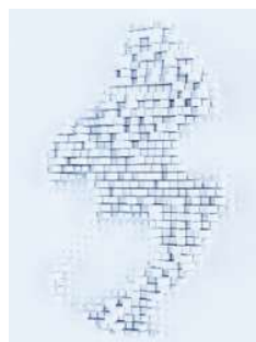
Darstellung mit dem neuen HEINE DELTA 30 PRO