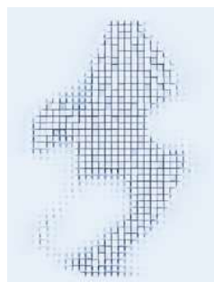
Darstellung mit einem herkömmlichen Dermatoskop

Bei einer Hautuntersuchung zählt jede Kleinigkeit. Deshalb haben wir die LED HQ beim neuen HEINE DELTA 30 PRO neu angeordnet. Dadurch erreicht das Licht tiefer liegender Hautschichten und es entsteht ein extrem plastischer, räumlicher Eindruck von Läsionen, ähnlich einer 3D Darstellung.